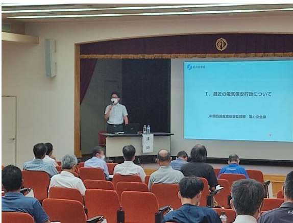
講演の様子（鳥取会場）