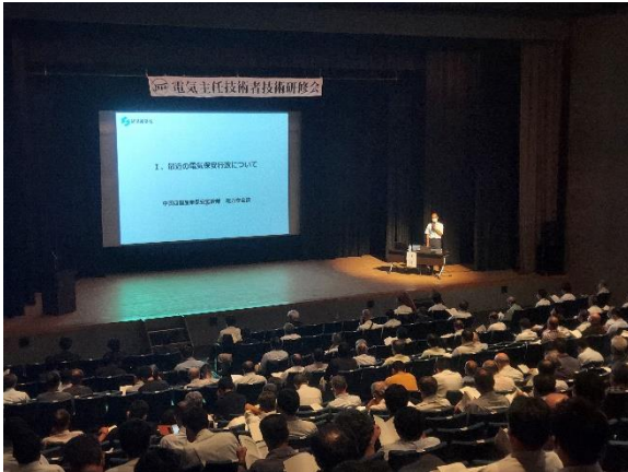
講演の様子（広島会場）

公益社団法人日本電気技術者協会中国支部が中国地域5箇所で開催する電気主任技術者技術研修会において、現場で活躍されておられる電気主任技術者等の方々に対し、当部職員が最近の電気保安行政について、講演を行いました。